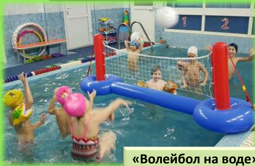
«Волейбол на воде»