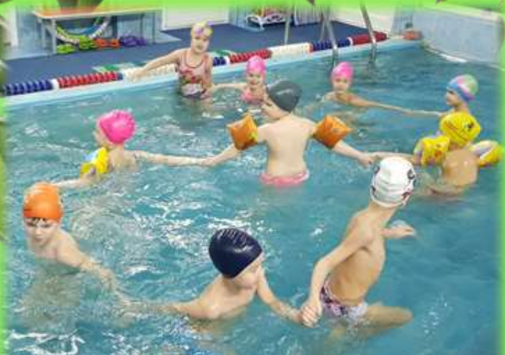
«Поймай свой хвост»